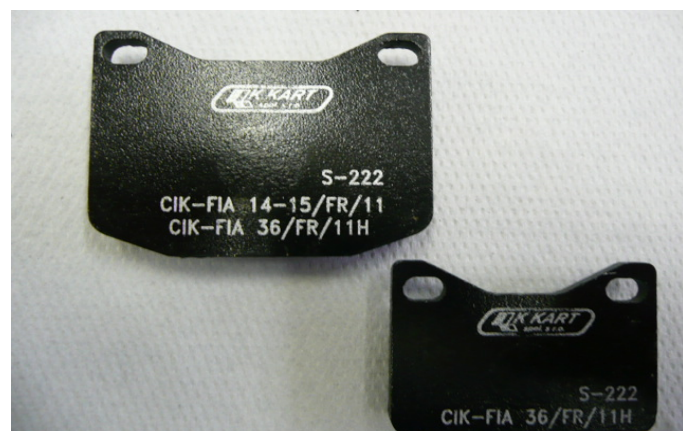
Plaquettes / Pads