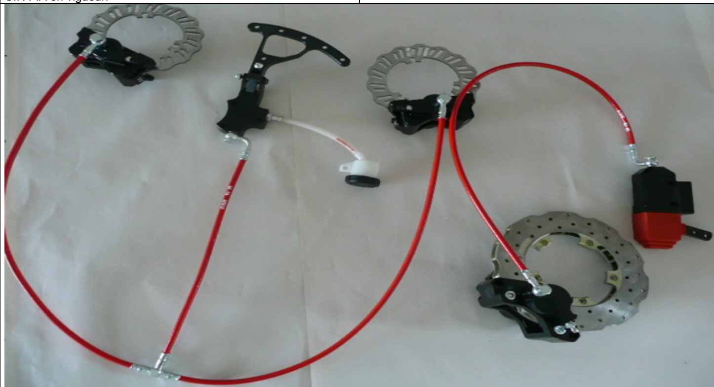
PHOTO VUE DE DESSUS DU SYSTÈME COMPLET ASSEMBLÉ PHOTO FROM ABOVE OF COMPLETE ASSEMBLED SYSTEM

This Homologation Form reproduces descriptions, illustrations and dimensions of the brake system at the moment of the CIK-FIA homologation. The Manufacturer may modify them, but only within the limits set by the CIK-FIA Regulations in force.