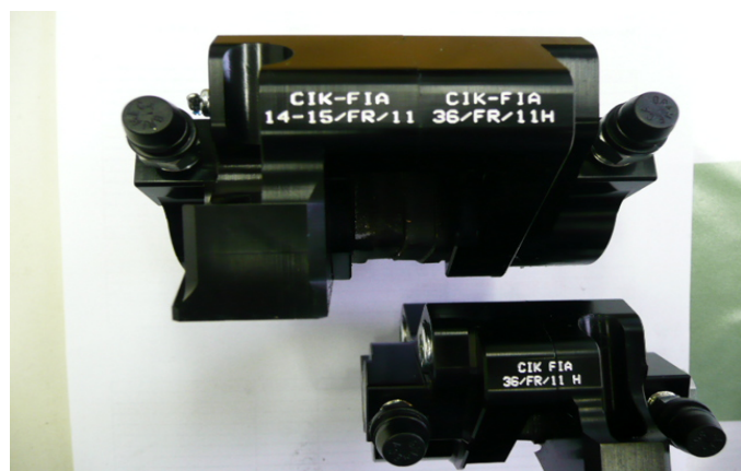
Etriers / Calipers