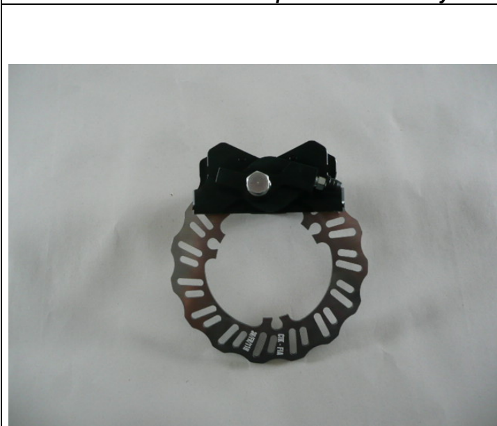
Photo du frein avant : étriers et disques seulement Photo of front brake: calipers and discs only