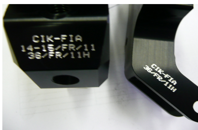
Maitre-cylindre / Master-cylinder