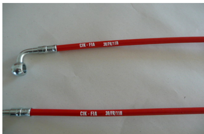
Tuyaux / Lines