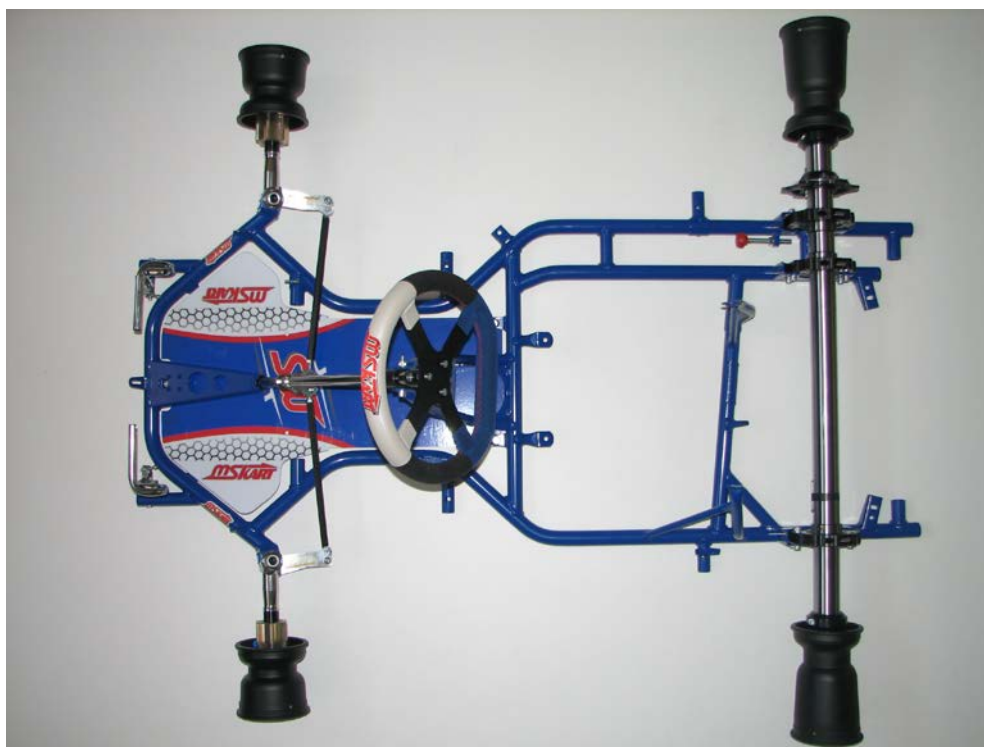
PHOTO VUE DE DESSUS DU CHÂSSIS COMPLET IDENTIQUE À L'UN DES MODÈLES PRÉSENTÉS À L'HOMOLOGATION SANS PARE-CHOCS, FREINS, CARROSSERIE, SIEGE, NI PNEUMATIQUES

This Homologation Form reproduces descriptions, illustrations and dimensions of the chassis frame at the moment of the CIK-FIA homologation.