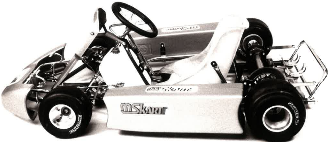
Photo du Kart avec carrosserie et pneumatiques