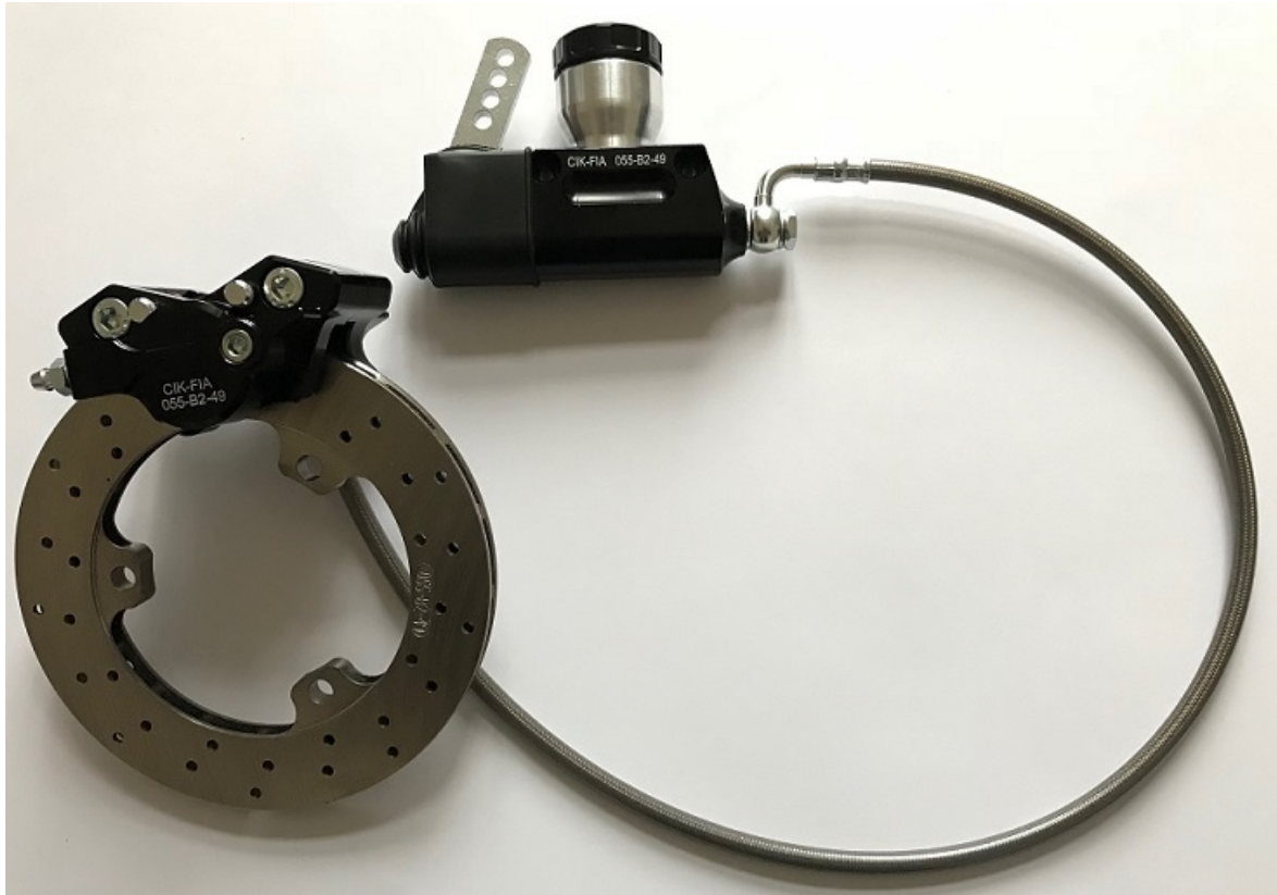
Photo vue de dessus du système complet / Photo from above of complete system

Signature et tampon de l'ASN / Signature and stamp of the ASN