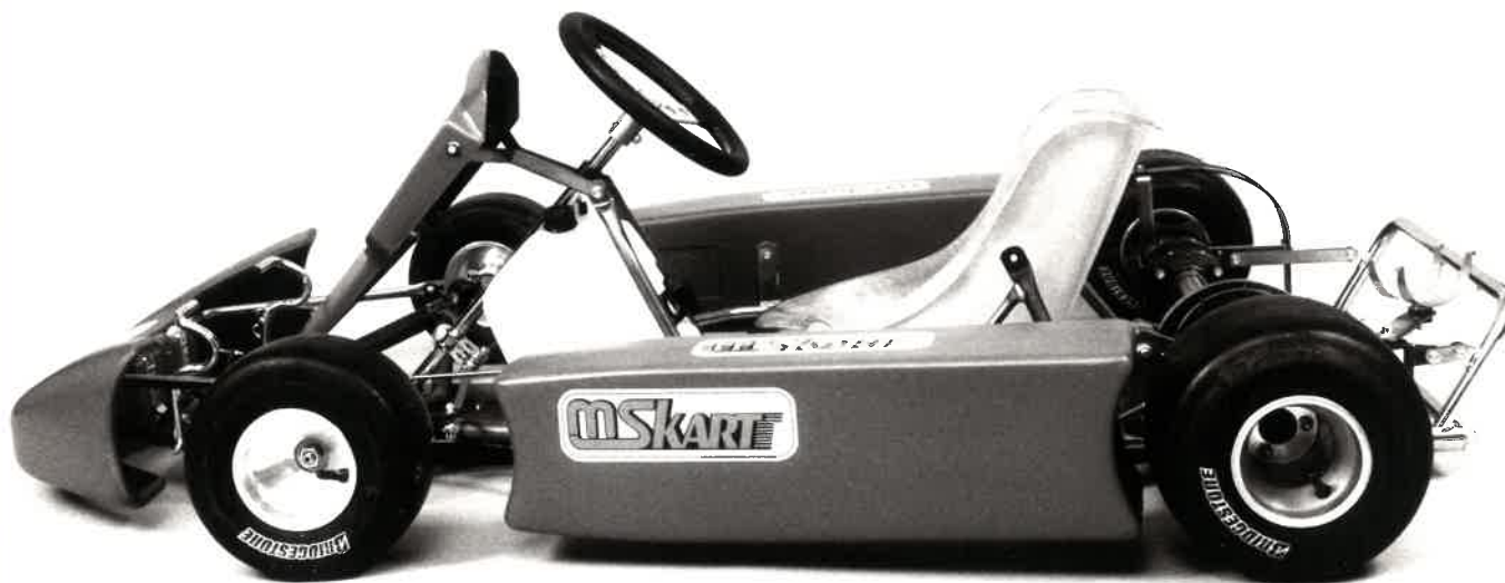
Photo du Kart avec carrosserie et pneumatiques

This homologation sheet reproduces descriptions, technical drawings and dimensions at the moment of the FMK-FIA homologation. With its homologation application, the applicant confirms, that all the requirements of the regulations are respected in full.